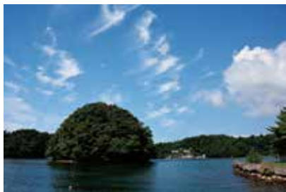
能登町の九十九湾（能登半島） 奥の入り江に見えるのが臨海実験施設

海洋環境領域の中心となる臨海実験施設は、能登半島能登町の九十九湾に面しています。自然システム学類の1名を含む教員5名、技術系職員2名、事務系職員1名の合計8名が当施設に常駐し教育・研究を行っています。