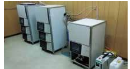
室内ガス捕集装置