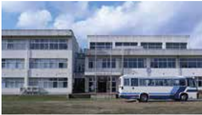
輪島測定局外観・ 室外粒子捕集装置と気象観測装置