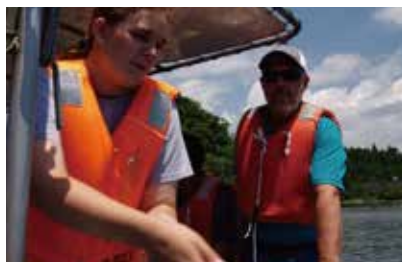
イリノイカレッジ（アメリカ合衆国）の乗船実習 プランクトンネットを曳いている様子

これまでの教育での実績が評価され、2012年7月31日付で当施設は日本海域環境学教育共同利用拠点に認定されました。北陸3県の大学の臨海実習を行う拠点として1958年に当施設が発足して以来、本学