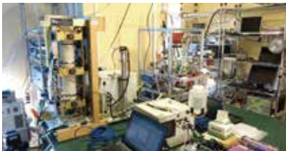
室内大気エアロゾル測定装置

北東アジア地域は世界的にみて最も大気汚染物質の排出が多いホットスポットとなっており、いまや世界共通の課題である大気環境問題の最前線にある地域といっても過言ではありません。大気汚染物質は依然最大の環境健康リスクに数えられるほか、地球温暖化など気候変動の要因ともなることから、大気汚染