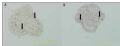
パバーグラスで押しつぶしたウニの幼生（矢印は骨片を示す） A：無添加のコントロールのウニ B：水酸化体処理のウニ