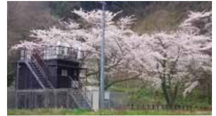
珠洲測定局外観 (旧小泊小学校)