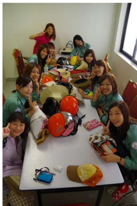
写真1. 打合せのようす

一方で、2週間にわたり8名もの学生の安全を確保するためには、チューターの存在が不可欠であることを改めて感じた。活動全般をよく把握しており、土地勘もあって公団スタッフのこともよく知るチューターの存在が、参加学生たちの心理的負担を大きく軽減したことは間違いない（写真2）。