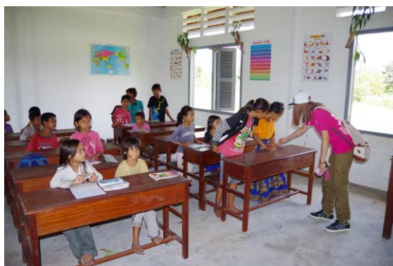
写真3. ルン・タ・エクでの学校訪問

本学のふたりが教員になることを志望していることから、フィールド実習ではアンコール遺跡に加えて教育施設の視察を行った（写真3）。残念ながら、9月はカンボジアの学校が長期休暇中であり、多くの学校が閉まっていた。それでもタイミング良く訪問できた学校において、子どもたちが教室内で身を寄せ合って学ぶ様子を垣間見ることができた。教科書や文房具が十分でない環境にあるものの、屈託のない