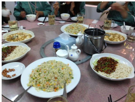
写真3. 麻婆豆腐の辛さは忘れません

業務は夕方には終わるので、夜は基本的にフリータイムです。夜は皆でご飯に行ったり、ナイトマーケットという店が集結している所で値切り大会をしたり、マッサージに行ったりしていました。ご飯は2週間で中華（写真3）、ベトナム料理のホー、カレー、カンボジアの家庭料理のアモック、日本料理、ラッキーバーガー、スムージー、アイスなど沢山食べました。安くて量も多く本当に美味しいです。お気に入りのレストランは、タイガーカフェとブルーパンプ