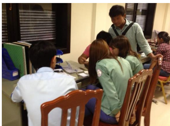
写真3. 午後のディスカッション

業務では主に、午前中に貯水池や水門や遺跡や村などを視察したのに対し、午後からはディスカッションの時間であった（写真3）。遺跡の説明や水の重要性など、様々なことを教えていただいた。それに加え、実際に目で見て感じたことや、改善したほうが良いと思ったことなど、自分の意見を話した。私はこの時間を少しつらいと感じていた。カンボジアの状況について考えるとき、どうしても心の中で日本と比べてしまった。カンボジアの状況を見て思うこと