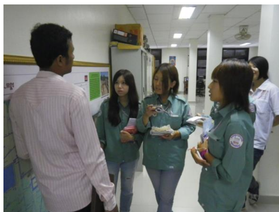
写真6. 公団職員と学生とのディスカッション

(3) 学生たちの活動がアンコール世界遺産公園で大きな話題となった（宣伝効果）。安全管理の観点から、参加学生たちはアンコール遺跡整備公団の制服を着用して日常の業務に