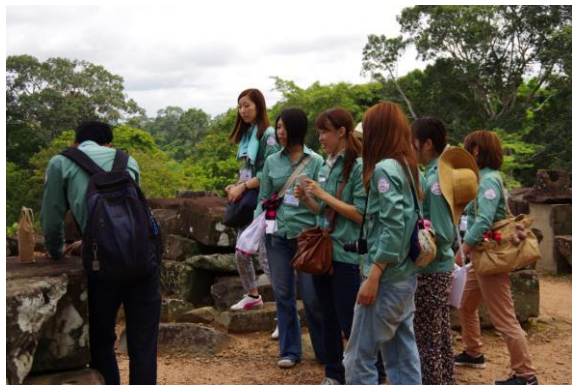
写真2. 公団職員による現地での説明