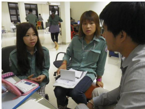
写真1. サックさんとのディスカッション

今回の業務でウォーターゲートを何か所か見たが、どこから水が流れてきてどこに流れていくか水のプロセスを学習した。日本のように堤防や水門は強度が強いものではなさそうだが、人工的に水を調節して供給することがいかに人々の生活や遺跡に重要なのか間近で感じる事ができた。そして、公団の人と水が流れるプロセスや西バライの事業などのディスカッションを行った（写真1）。西バライは南北 2.2 km、東西 8 km と大規模で、西バライの貯水はシェムリアップ川からビッグウォーターゲートを通り、運河を通り西バライのウォーターゲートで調整して貯水される。山で木が切られると水がなくなり、北バライにも水がたまず、西バライまで水が流れてこなくなることを知り、水を安定してためることは容易ではないことが分かった。