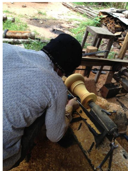
写真2. 太鼓を作っているようす

その他にも、水の働きや遺跡の神話、エコビレッジの問題点など建築様式以外にもいろいろ学べたことはカンボジアという国を知るうえで自分にとってプラスになりました。