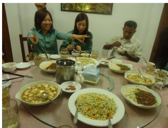
写真1. お気に入りの中華料理店

去年の経験から、おいしいごはんのお店やマッサージのお店を今年度の学生に伝えるのも私の仕事ではあったのですが、学生たちがとても好奇心旺盛だったために新しいお店を開拓し、逆に教えてもらうこともありました（写真1）。来年度の参加学生にも新たにいいお店を見つけて、後輩たちに伝えていってほしいと思います。私は報告会やこのインターンシップの紹介でたびたび言ってきたのですが、シェムリアップにはおいしいものが本当にたくさんあります。中華料理は今年度の学生のお