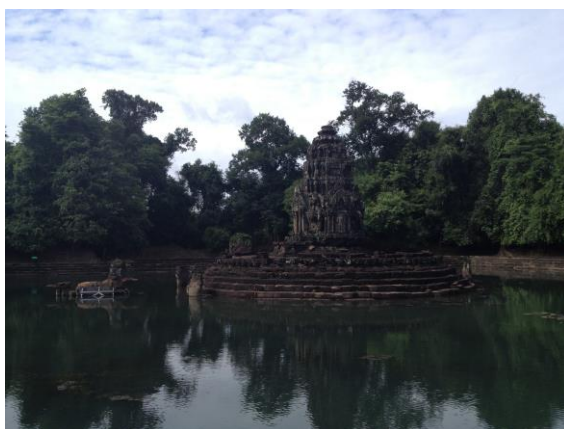
写真2. ニャックポアン遺跡

北バライの中心にはニャックポアンという遺跡があるが、この遺跡について私たちは詳しく知ることができた（写真2）。病院として利用されていたというこの遺跡の仕組みや、水の流れ、それを囲う土手やお堀の役割など、北バライのことを学ぶ上で重要な点が、このニャックポアンには凝縮されているように感じた。他の遺跡とは違い、この遺跡には水がたくさんあり非常に美しかった。観光客では入れないような場所まで見せていただき感動した。