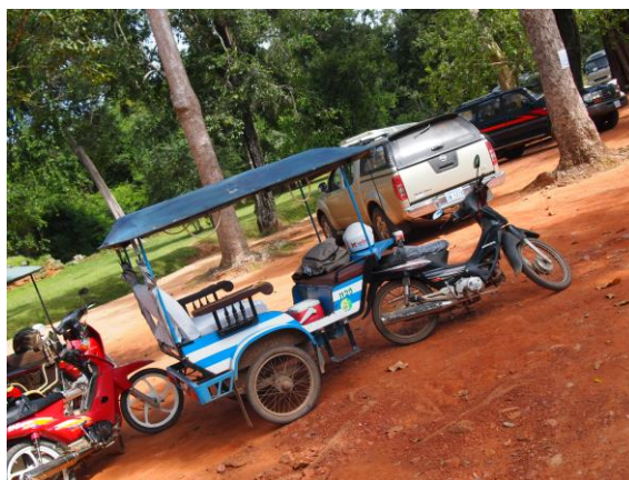
写真3. トウクトウク

業務後や休日は、シェムリアップの市場や町で買い物などを楽しんだ。カンボジアは日本に比べて大変物価が安く、マッサージが10ドル(約1000円)以下であったり、お酒落なペディキュアが5ドル(約500円)でしてもらえたりと、安さとカンボジアでこんなことが出来るのかと驚いた。また、カンボジアに行くと言うと、「不便そう」、「食べ物美味しくなさそう」と言われることがある。しかし、食べ物はカンボジアの伝統料理から、カレー、ピザ、中華料理など種類豊富で大変美味しい。滞在に必要なものはスーパーで揃えることができ、