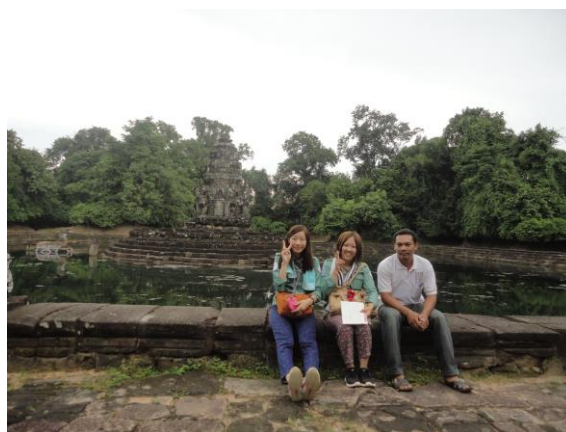
写真3. 北バライのニャックポアン遺跡