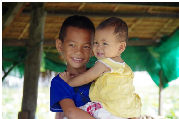
写真2. 湖畔のハス畑の兄弟