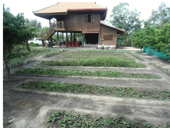
写真2. 整備された畑