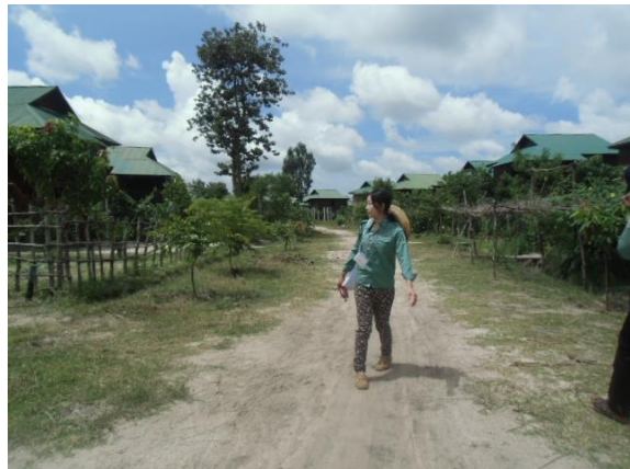
写真1. ルン・タ・エク村にて

しかし、現在のルン・タ・エク村は住民が思うように集まらず、とても閑散としている。私が最初にルン・タ・エク村を訪れた時は、きれいな家がきちんと並んでお