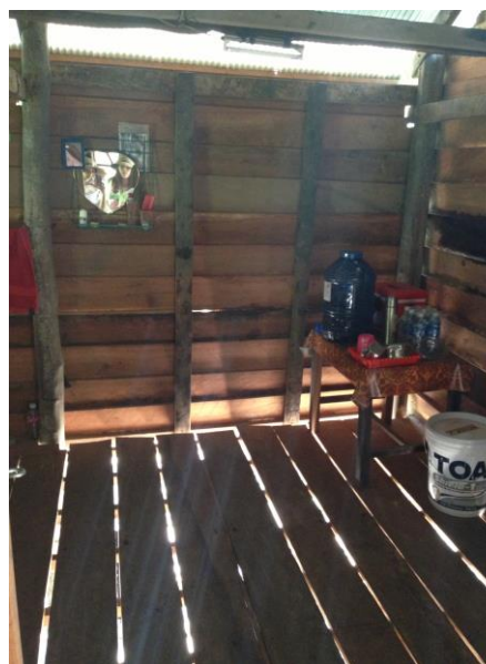
写真1. ロンルンハウスの床