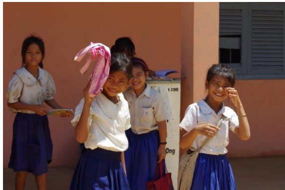
写真1. ロリオス村の学校

9日間全てにおいて私が目の当たりにしたのは、「貧しい国」という先入観とのギャップである。私はカンボジアに関する知識がほとんどなく、テレビなどの情報から勝手なイメージだけを持っていた。日本と違うところ、私の常識外なところはたくさんあったが、それはカンボジアらしさなのだと気付いた。現地の人々の笑顔を見る限り、ただ貧しく辛い毎日を送っている人はいないと