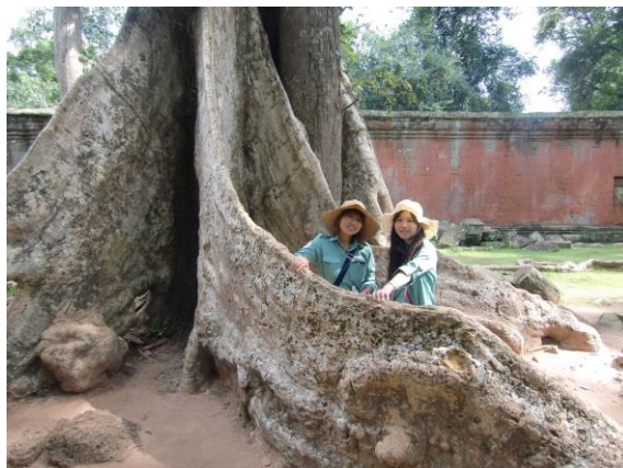
写真3. タプローム寺院

林させてもらいました（写真2）。鍬を持つのもやっとでしたが、地域の人にも手伝ってもらって無事植林することができました。気温は30度を超えるなか地域の人はずっと植林しており、機械も使ってなかったので大変そうでしたが、どの人も笑顔で私達を受け入れてくださってとても嬉しかったです。午後はオフィスに戻り、西バライについてもっと詳しく説明を受けました。西バライの問題を解決するには、1）堤防の修復、2）木を植え直す、3）考古学的な発掘、4）観光事業への取り組み、の4つのステップがあることが分かりました。「なにか意見はないか？」と聞かれたので、「日本では植林するとき大きく成長した木を植えるが、今日自分が植えた木は細かったので大丈夫か？」と伝えたところ、「コストがかかるため、細い木を植えているが強さはあるので大丈夫だ」と返ってきて、政府にお金のないカンボジアと先進国としての日本との違いを感じました。毎日の業務は、午前は外へ出かけて現場を見て、午後はオフィスでディスカッションというように進んでいきました。公