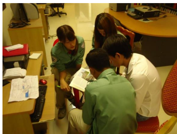
写真4. ディスカッションのようす

った。徐々に、英語に慣れていくうちに少しずつ伝えられるようになり、意見を伝えることで相手の意見も引き出すことができ、さらに理解や考えを深めることができた（写真4）。これは英語だけでなく、日本語でも同じであると感じた。また、伝えることは英語に関するだけでなく、カンボジアの観光に対して必要なものであると感じた。アンコール遺跡は魅力的な観光資源であるが、アンコールワット、タ・プローム寺院など有名な場所に人が集まり過ぎているという問題がある。有名所のほかにも多くの素晴らしい遺跡があり、そのような所にもぜひ観光客に足を運んでもらいたい。そのためにも、魅力を伝える、アピールしていくということが重要である。