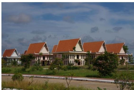
写真7. アプサラ公団新本部

なお、来年度の実施にあたって懸念されることは、冒頭でも述べたとおり、アプサラ公団本部がシェムリアプ市の郊外に移転してしまったことである（写真7）。かつての本部はシェムリアプ市街地に近く、またアンコール世界遺産公園に隣接していたため、学生たちが宿泊するホテルからの通勤や業務地への移動が容易であったが、移転先は市内のホテルからの通勤や業務地への移動に片道30分以上がかかる距離にある。新本部の周辺には宿泊施設や食事をする場所がまだ整備されていない。この問題については、業務地の変更や宿泊地の再考など、現地の整備状況を見ながら公団側と協議を進め解決を図る予定である。