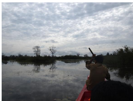
写真1. 北バライ（ポートの上から）

業務は、午前中は主に視察、午後にディスカッションという形で進められ、ディスカッションでは意見の交換、質問をするという形で進められた。私は北バライ周辺を管理するチームでお世話になった。北バライはアンコール遺跡群にある4つのバライ（人工貯水地）のひとつであり、中心にはニャック・ポワンという非常に美しい遺跡があり、現在、新しい観光名所として開発されている地域である。北バライは過去に管理されておらず、水がなかった時期が