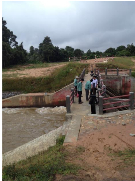
写真1. 流れを調節するスライドゲート

私たちグループ1は、北バライを中心に活動しているチームのみなさんにお世話になった。バライとは貯水池という意味であり、北バライ、西バライ、東バライ、南バライが存在する。その中には以前は水を蓄えていたが、今では水がなく、人々がそこに住んでいるという特殊な例も存在する。公団の方は、今は水がなくなってしまったこの地域にもいずれかは水を入れたいと考えているが、人々が住んでいるのでどうすることもできない、とおっしゃっていた。水はカンボジアの人々にとって（もちろん世界中の人々にとっても）非常に重要なものである。それゆえ、この地域に水を入れるかどうかは、かなり難しい問題になっている。バライでは、雨季には乾季にむけて水を貯え、ゲートを上げ下げして川を流れる水の流れを調節するスライドゲートというものを利用して水を管理している。農作地域に水を供給し、洪水の際にも不可欠なものである。また、山から流れてくる水を北バライの近くのゲートで止めて、そこを分岐点として川を3本に分けていた。この分岐点は非常に重要なものである、と公団の方はおっしゃっていたが、それにしては設備が不十分だなど思ったのが、私の本音である（写真1）。