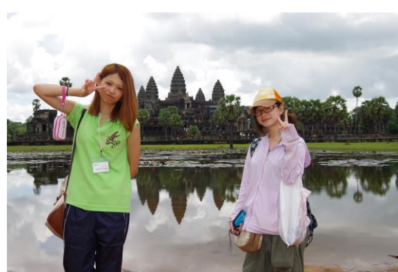
写真2. アンコール遺跡の見学

私たちはカンボジアにいる間、アンコールワットをはじめ、ニャック・ポアンやバイヨンなどたくさんの遺跡を見学し(写真2)、その周辺にある生態系について学んだりすることができてとても充実した毎日過ごすことができた(写真3)。トンレサップ湖の周辺の家庭に訪問して学校教育についてインタビューしたりすることもでき、その周辺に住んでいる子どもたちがどのような生活をしているのか、どうやって学校に通っているのかなども聞く