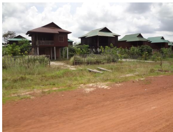
写真1. ルン・タ・エクの住宅棟

正直なところ、今の村の現状では目標である旅行客のホームステイにはほど遠く、それにもかかわらずエコにこだわって村づくりが進まないといったことに少し先が思いやられた。しかし、住居は伝統的な高床式でまだ建てられて日が浅いこともあり真新しくきれい