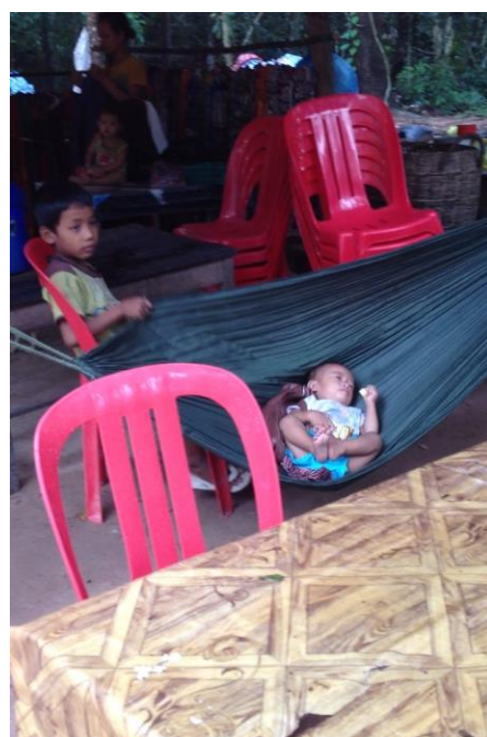
写真4. 村の子どもたち

また、カンボジアでは多くの子どもが働いている ということが衝撃的であった。本当に小さい子が赤 ちゃんの世話をしている場面になんども出くわした (写真4)。観光地では、自分の体よりも大きな籠を さげて、観光客に近寄り、土産を売っていた。格差 があると感じた。しかしここでもどうすることもで きず、笑顔でやんわりと商品を断ることしかできな かった。また、孤児院にも行かせていただいた。こ この子どもたちは本当に元気で、私たちが持って行 った遊び道具を見るやいなや、すぐさま飛びついて みんなで遊んだ。英語を話せる子もいて、親がいな いという状況でもたくましく育っていることに感動 した。