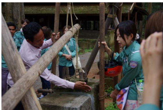
写真2. アンコール遺跡で説明をうける

それからスタッフの方々が連れて行ってくださった、たくさんのアンコール遺跡群は、どれも圧巻のスケールで当時の繁栄が感じられ、素直に感動した。スタッフの方はとても遺跡に詳しく、どの遺跡についても建てられた年、建てた王、建築者、遺跡に祭られている神々のことまでこと細かく教えてくださった。おかげで私たちもかなり遺跡についての見聞が深まった。そして私は彼らの知識量から仕事に対するプロフェッショナルな一面を見、とても尊敬した。仕事への姿勢はこうあるべきだと見せられた10日間だった。