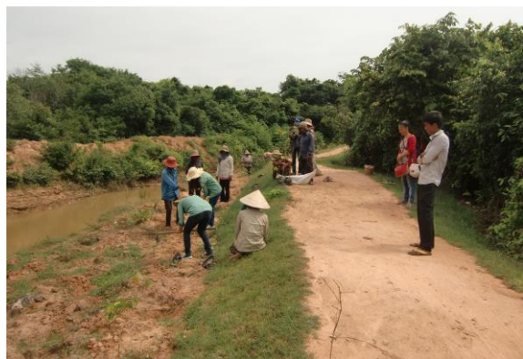
写真2. 西バライでの植林のようす