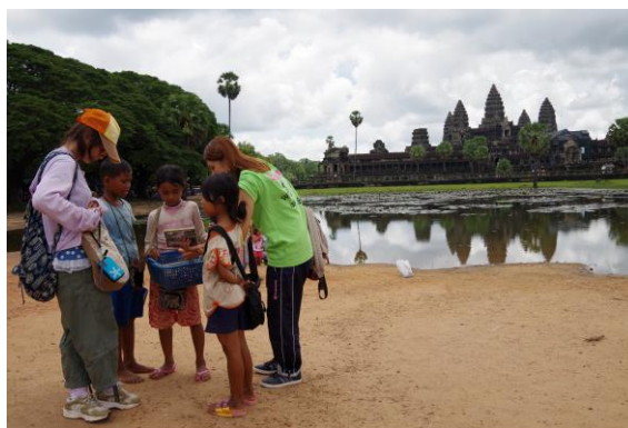
写真5. 民芸品を売る子どもたちと

笑顔で「勉強が楽しい」と話す子どもたちに出会ったことで、教育の本質を考えるきっかけになったと思う。学校訪問と並行して家庭訪問も行い、決して裕福とはいえない家庭において、そこに住む人々が生き生きと暮らしている実状を目の当たりにした（写真4）。ここで暮らす普通の子どもたちが観光客を相手に民芸品の売り子をしていることを知り、はじめのうちは観光地で会った売り子たちを迷惑そうに感じていたふたりが、家庭訪問後には売り子たちを勇気づけるような声掛けに変わっていた（写真5）。