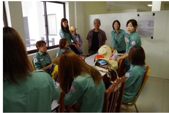
写真1. 金沢大学の打合せ

私たちがカンボジアに到着したときには金沢大学のインターンシップは半分が終了していた。このときすでに、金沢大学の学生さんたちはアプサラの公団職員とスムーズにコミュニケーションをとれていたことにとても驚いた。日本にいる間にインターンシップの様子の報告を受けていたが、実際に職員たちと議論したり質問したりしている様子を間近で見て、インターンシップ自体は2週間という短い期間