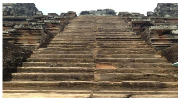
写真4. タケオ寺院の階段

さらに、個人的にタケオ寺院の階段は急で危ないので、手すりをつけられないのかなと感じました（写真4）。もしくは監視員を置いて観光客の安全の配慮に気を配るなどが必要ではないかと思います。