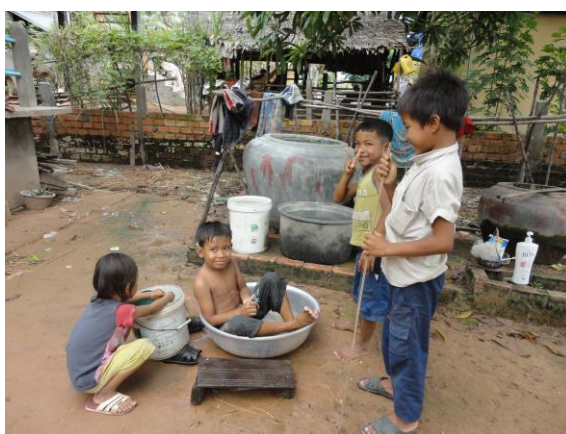
写真4. 庭で遊ぶ子供たち