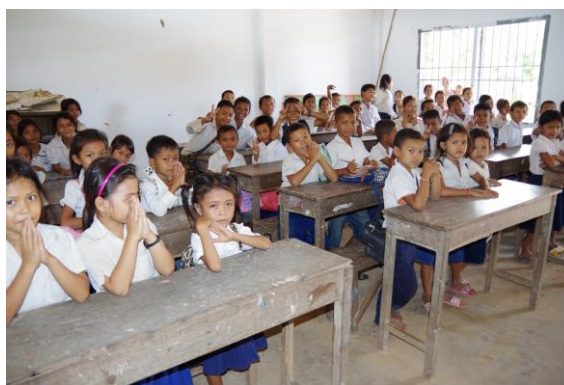
写真4. カンボジアの小学校