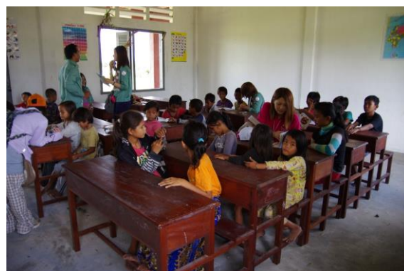
写真5. 埼玉大学の海外フィールド実習