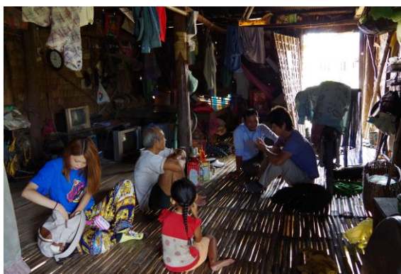
写真4. トンレサップ湖での家庭訪問