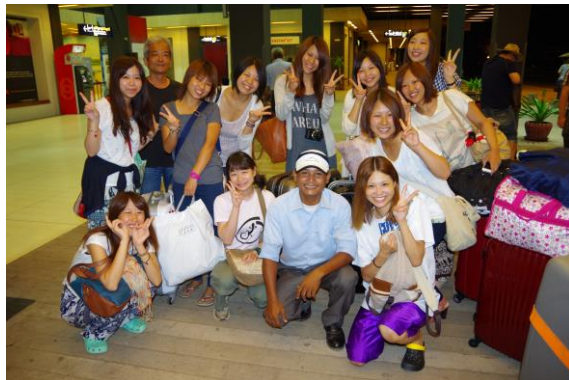
写真4. 金沢大学の学生たちと