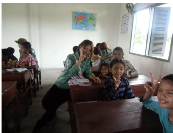
写真4. 村の子どもたちと

この2週間のインターンシップは、今後の自分の糧になるものを本当にたくさん得ることができた。私は将来公務員になって人の生活に関わる仕事をしたいと思っているが、今回文化も価値観も違う海外で村づくりの仕事に携わり、住民に真摯に向き合う公団員の方や、日本とはかたちの違う「幸せ」を持った現地の人々に出会い、自分の将来像がくっきりとしたものになった。最後に、カンボジアの発展を願うとともに、今回のインターンシップで出会ったすべての人に心から感謝しています。本当にありがとうございました。