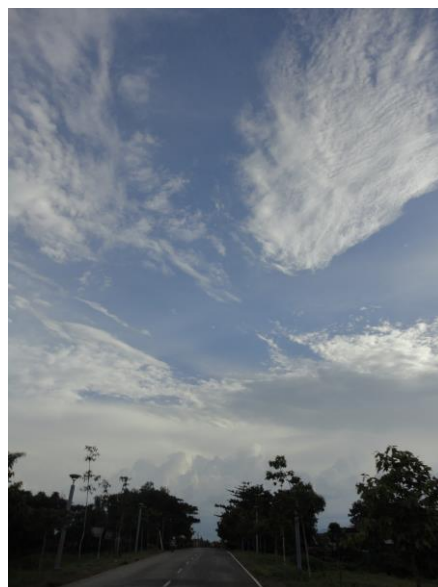
写真2. バイクから見上げた空

“STUDY OFFICE”では、伝統的なクメール建築について学んだ。環境デザイン学類生として非常に興味深く、日本にある家屋の建築様式しか見たことのなかった私には衝撃的だった。しかし、その地その地の環境にあった建築様式があり、クメール建築も、日本家屋もその地ではベストであ