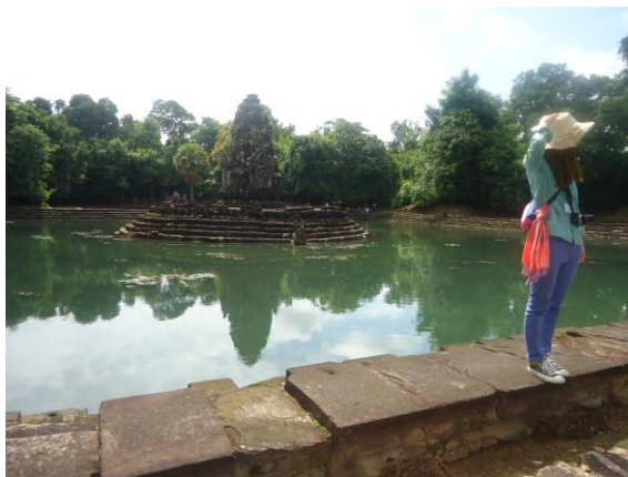
写真2. 北バライのニャックポアン遺跡

1年ぶり2度目のカンボジアでしたが、変化している部分も多く見られました。去年全く水がなかった遺跡が今年は水で満たされていて、水がある状態とない状態の遺跡を見ることができたのは私にとって景観を考える上で貴重な経験でした（写真2）。また、オールドマーケットに新しいお店ができていたり、去年あったお店が倍に拡大していたりなど、たった1年しかたっていないのに変化が見られ、これからシェムリアップがどのような変貌を遂げるのかが楽しみです。変化と言