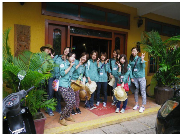
写真1. 初日にホテルにて

月曜日にアプサラ公団でのインターン業務が始まった(写真1)。公団の人はサンダル出勤で、制服を着ている人もまばらで、日本に比べてゆっくり、ゆったりマイペースに仕事をしている印象を受けた。その雰囲気と、スタッフの皆さんが温かく、そして優しく接して頂いたおかげで、初日からガチガチになることなく、自分もまるでカンボジア人のように(とても良い意味で!)自由に学び、業務をこなす事ができた。